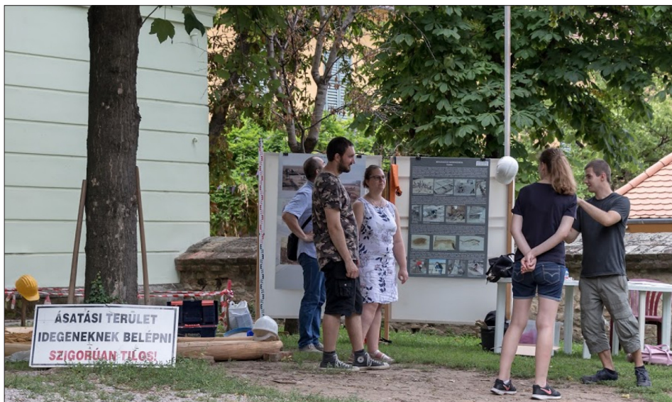
1. ábra: Múzeumok Éjszakája 2019 – a kép jobb oldalán a tanszék hallgatói

A megismert foglalkozás-típusok között volt „rendes” másfél órás múzeumpedagógiai foglalkozás, kitelepülő interaktív történelem-óra, ingyenes Múzeumi Kedd-alkalom, és végezetül a Múzeumok Éjszakája, mint tömegrendezvény.