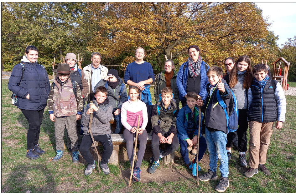
4. ábra: Gyerecsapat a Jakab-hegyi témanapon, felnőtt kísérőkkel, múzeumi munkatársakkal és egyetemi hallgatókkal, 2021

2021 őszén a múzeumpedagógiai gyakorlat tartásakor végre ismét lehetőség nyílt arra, hogy a nappalis mesterszakos hallgatók élőben látogathassanak el a kiállításainkba, és találkozhassanak a célcsoportokkal. Ez mindenki számára örömteli változás volt, hiszen