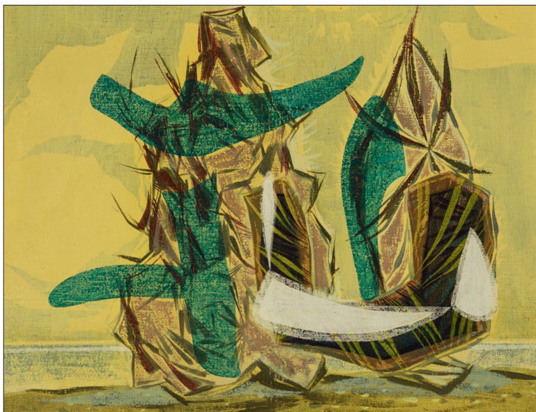
2. ábra: Martyn Ferenc: Írországi emlék, 1950