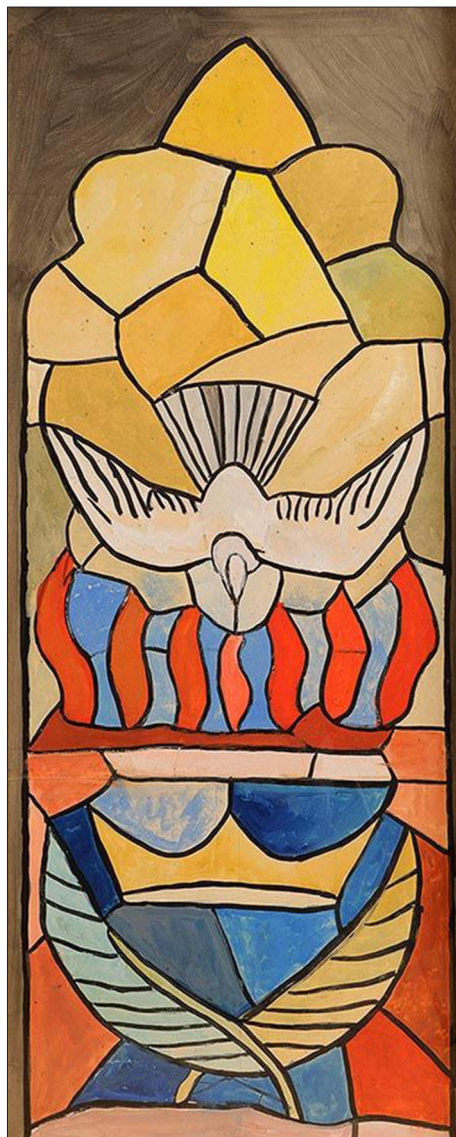
6. ábra: Evie Hone: Üvegablak terve é.n.