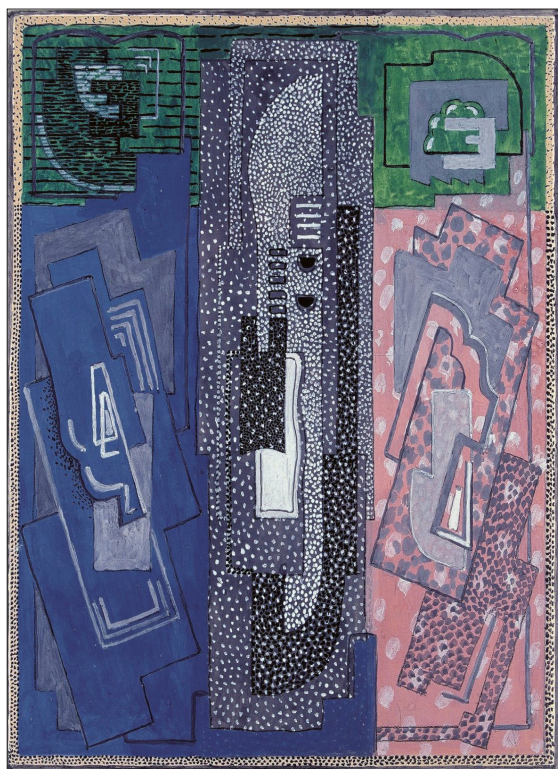
3. ábra: Mainie Jellett: Négyelemes kompozíció, 1925