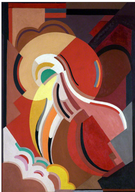
4. ábra: Mainie Jellett: Kompozíció, 1932-35