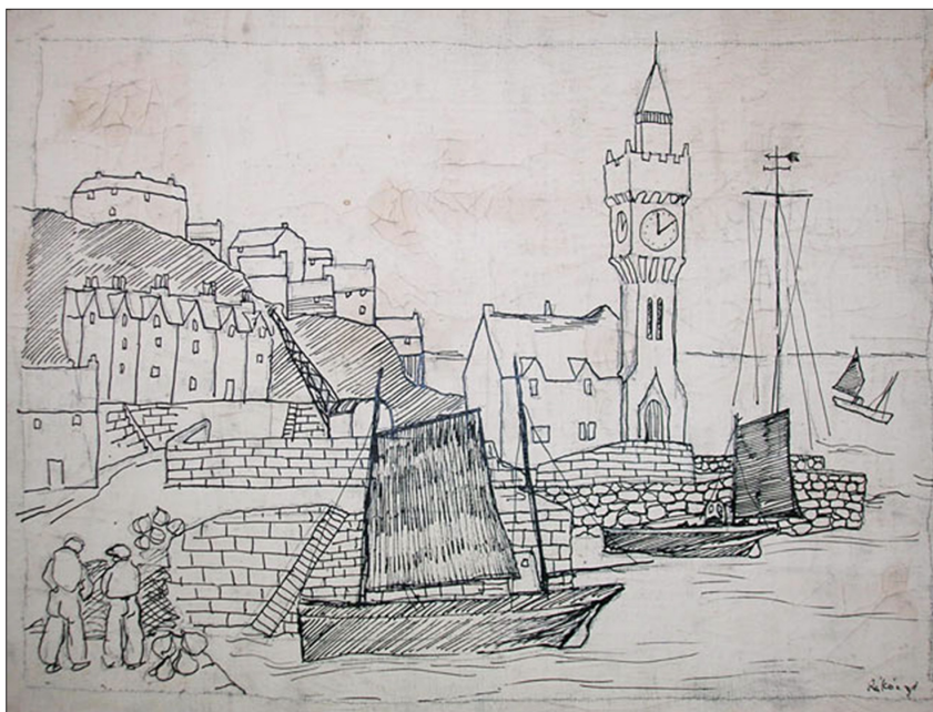
8. ábra: Basil Rakoczi: Kikötő, 1940